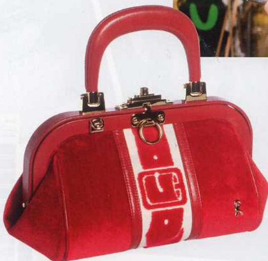
LE BAGONGHI, DE ROBERTA DI CAMERINO

ROBERTA DI CAMERINO, POINTS DE VENTE AU 04 94 97 05 94.